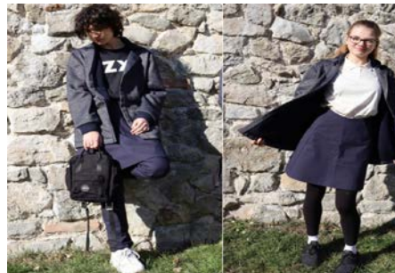
© PASCH-net, Schülerin und Schüler aus Bratislava, Slowakei