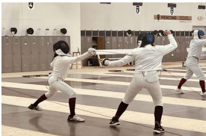
© PASCH-net, Schülerinnen und Schüler aus Portland, USA