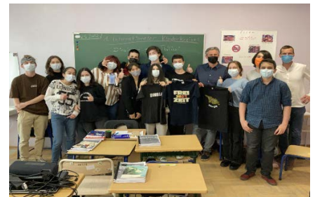
Kleidertausch von Schülerinnen und Schülern aus Georgien und Deutschland