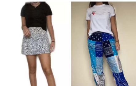
© PASCH-net, Magdalena Torres, Santiago de Chile, Chile