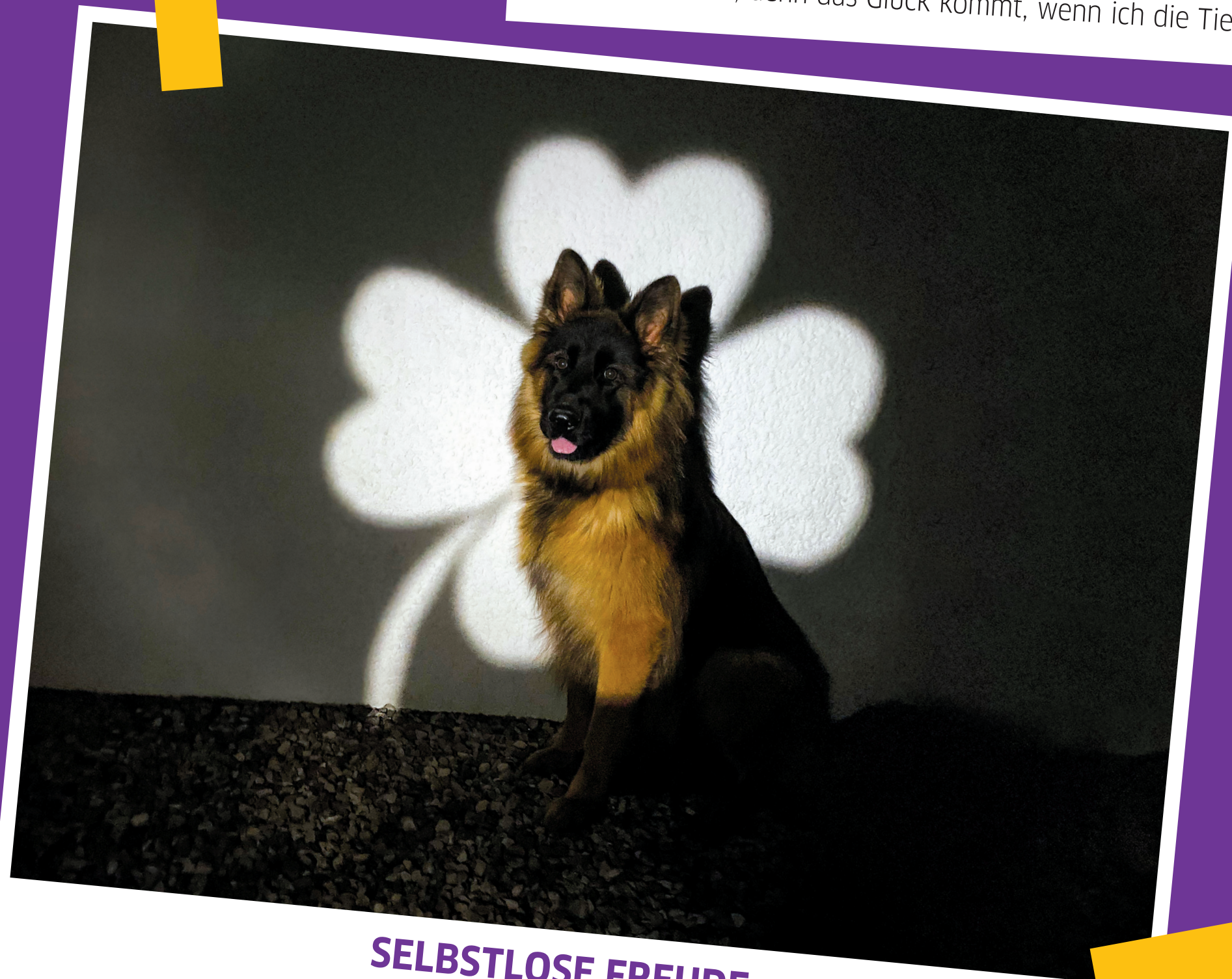
SELBSTLOSE FREUDE Wanasa P., Trabki Wielkie, Polen

Katzen sind süß und wunderschön. Sie sind lustig. Ich lache oft, wenn ich meine Katze beobachte.