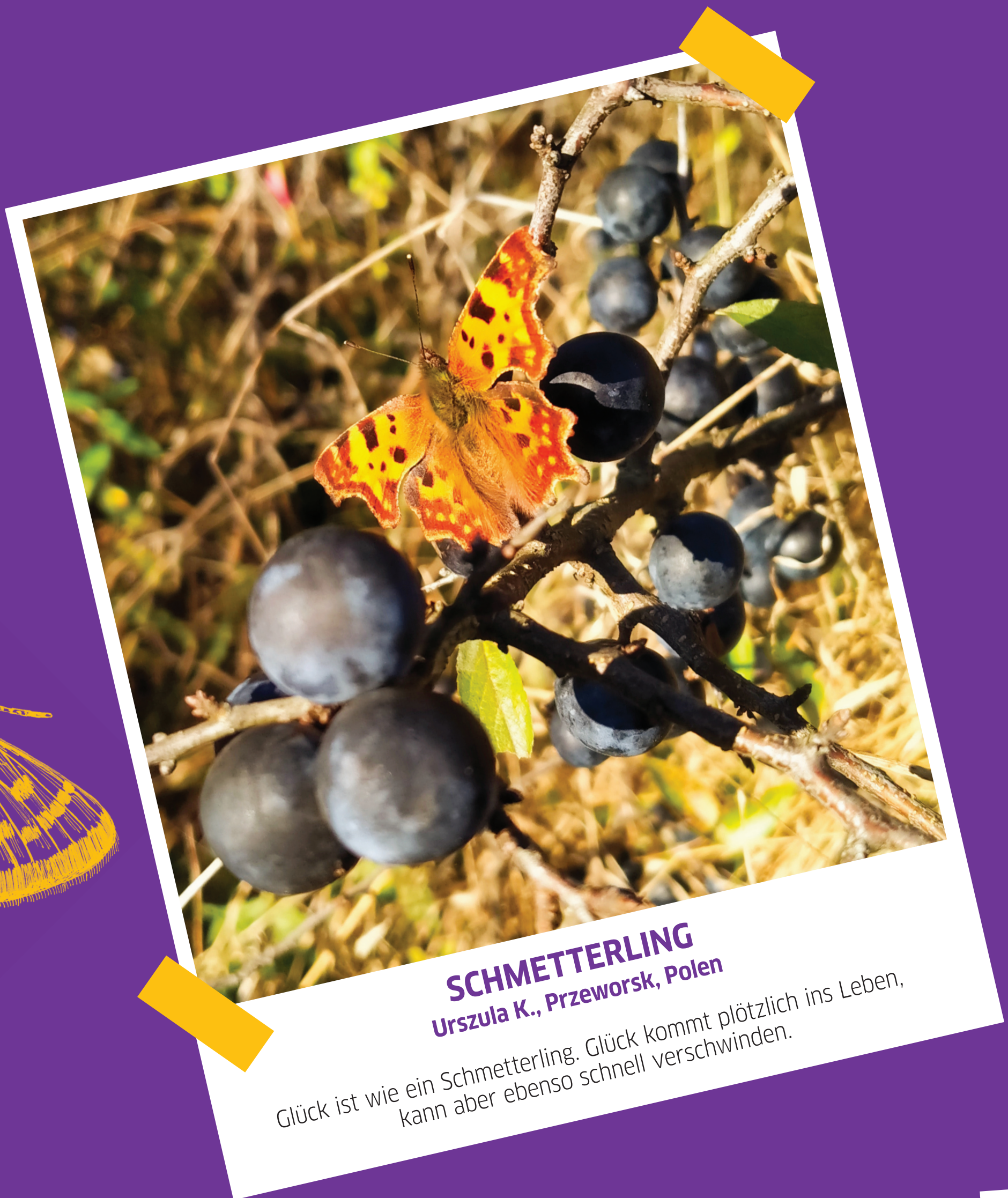
SCHMETTERLING Urszula K., Przeworsk, Polen

Glück ist wie ein Schmetterling. Glück kommt plötzlich ins Leben, kann aber ebenso schnell verschwinden.