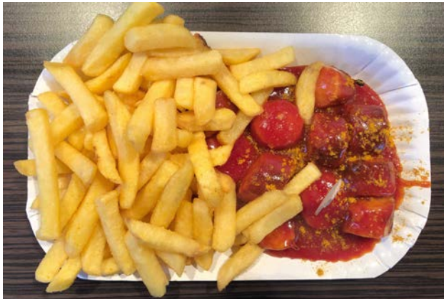
Currywurst mit Pommes