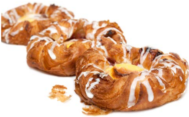
Gebäck | Ruslan Kudrin © Colourbox