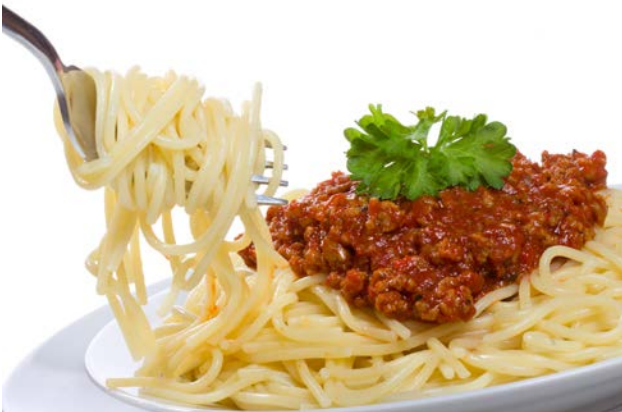
Spaghetti Bolognese

„Ich mag gerne Dhal, Spaghetti Bolognese , Spinat mit Ei und Kartoffeln, Pizza Salami und gebratene Maultaschen . Obst und Gemüse mag ich nicht so besonders gern. Aber in die Schule nehme ich immer Äpfel mit. Tomaten und Gurken esse ich auch. Mittags esse ich in der Kantine. Das Essen ist okay. Manchmal gibt es richtig leckere Sachen und manchmal ist es gar nicht gut. In der Pause esse ich eine Reiswaffel , Brot ohne Belag , einen Keks und geschnittene Äpfel. Das ist eigentlich immer das Gleiche. Am Wochenende mag ich am liebsten das Frühstück und unter der Woche das gemeinsame Abendessen. Ich esse gern eine Zwischenmahlzeit, wenn ich von der Schule nach Hause komme. Süßigkeiten mag ich auch sehr gerne. Meistens trinke ich Wasser. Aber manchmal trinke ich auch Limonade oder Cola. Im Sommer trinke ich sehr gerne Smoothies .“