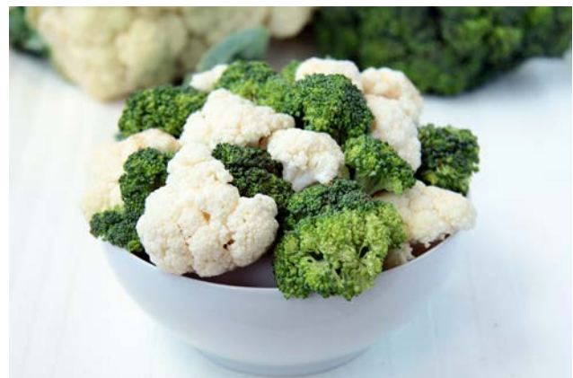
Blumenkohl und Brokkoli